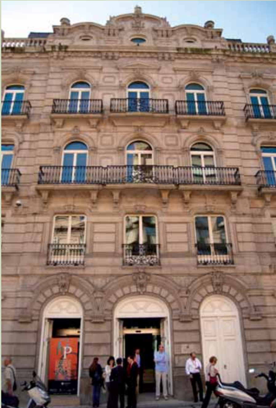
Fachada del Centro Social de Caixanova en Vigo

esencia de lo que fueron 2 jornadas que, a buen seguro, cobrarán mayor trascendencia con el paso del tiempo.