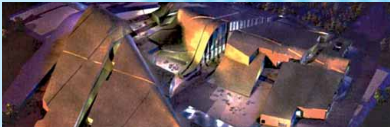
Proyecto Cidade da Cultura