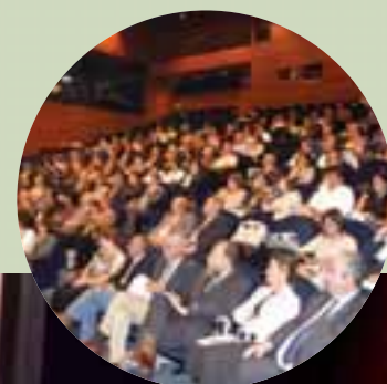
Instantánea de la apertura del Congreso