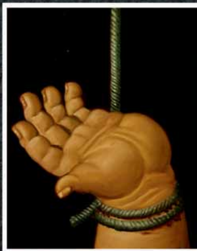
Abu Ghraib 67, 2005