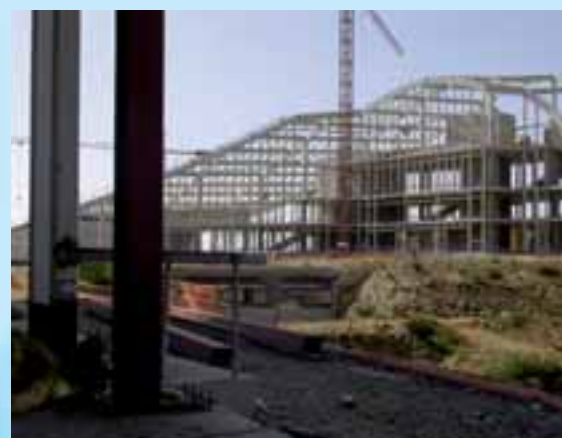
Museo de Galicia en su fase de construcción

Se ruega confirmación de asistencia antes del 26 de noviembre